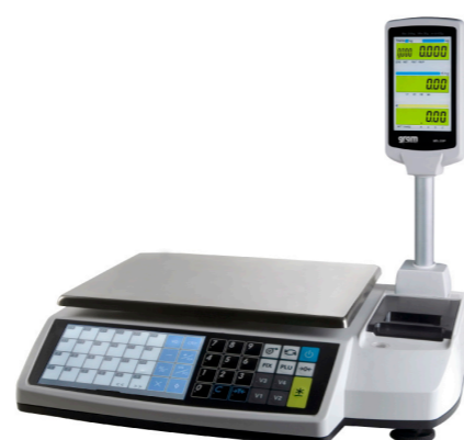
Serie M5 -30 P